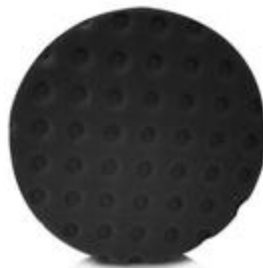
Dokončovací a leštící kotouč