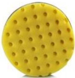
„Ostrý“ brousící kotouč