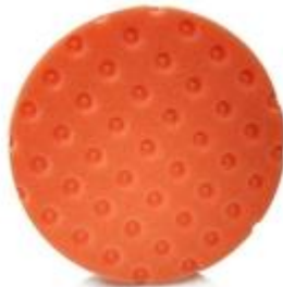
Střední brousící kotouč