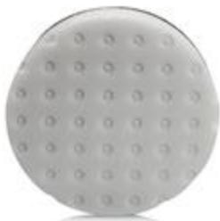
Střední nanášecí a leštící kotouč