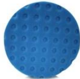
Kotouč Ultra jemný pro finální leštění