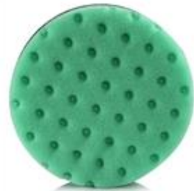
Střední leštící kotouč